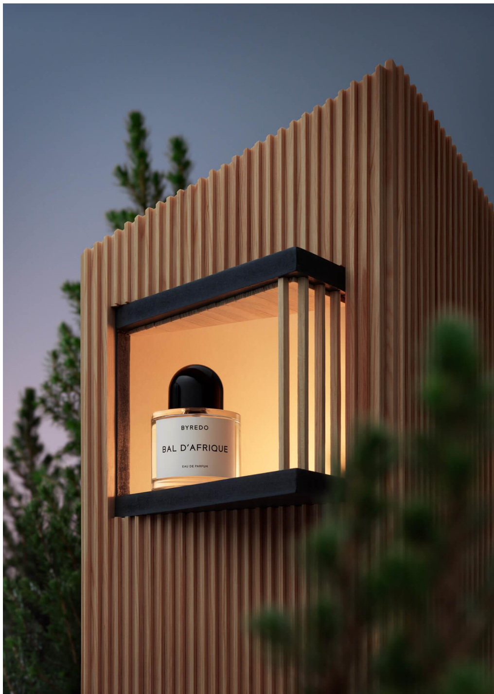
瑞典创意摄影师 Olle Broksten 的居家作品