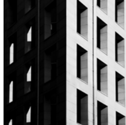
Architecture: Kamilla Hanapova