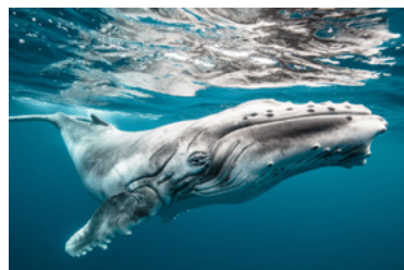
Wildlife: Karim Iliya