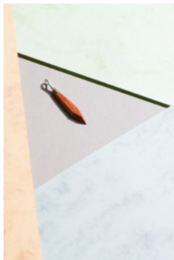
Product: Marcin Gizycki