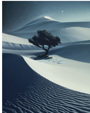
Landscape: Benjamin Everett